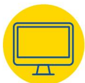
Programma per il mercato unico (SMP)

L'Ucraina aderirà ad altri importanti programmi di finanziamento dell'UE che aiuteranno l'Ucraina a beneficiare ulteriormente della cooperazione con l'UE e ad allineare il suo acquis in settori chiave: