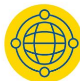
Collegare l'Europa Facilità

Nel 2022, l'Ucraina ha già aderito ai programmi Digital Europe, Fiscalis, Customs, EU4Health e LIFE .